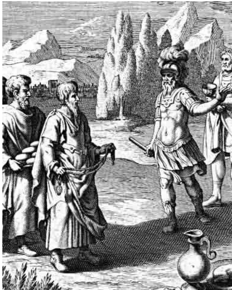
Ο ΑΓΗΣΙΛΑΟΣ, Ο ΒΑΣΙΛΙΑΣ ΤΗΣ ΣΠΑΡΤΗΣ

Οι ελληνικές πόλεις της Μ. Ασίας και η Κύπρος πέρασαν στην περσική κυριαρχία.